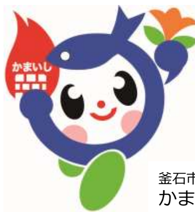
釜石市のマスコットキャラクター かまリン