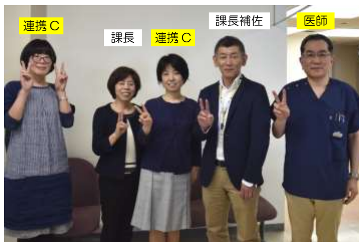
チームかまいしメンバー (平成 29 年度)

とはいえ、医師と対話するときや、診療報酬のこと、医療的処置が必要な患者が施設や在宅に戻れない問題等を話し合うときなどは、医療に明るい人の参画が不可欠です。そのため、医療的知識を担保すること等を目的として、医師会からアドバイザーを派遣していただいています。(週に一度ミーティングを行うほか、メールや SNS 等で常時連絡可能。)